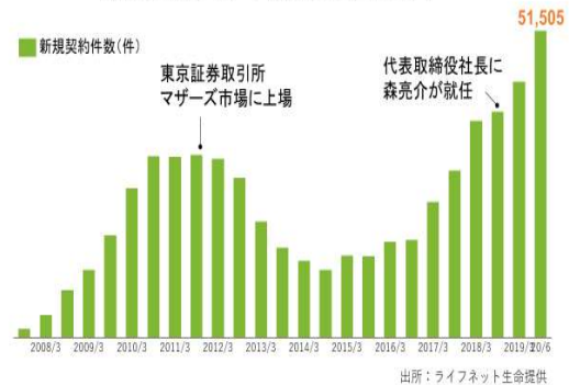
新規契約件数 半期推移(単位:件)

森 経営方針であらたに「顧客体験の革新」をコアに決めました。これは、ギリギリのところまで落ちた際に気づいた大事な事で、その感覚は当初の事業計画にはありませんでした。